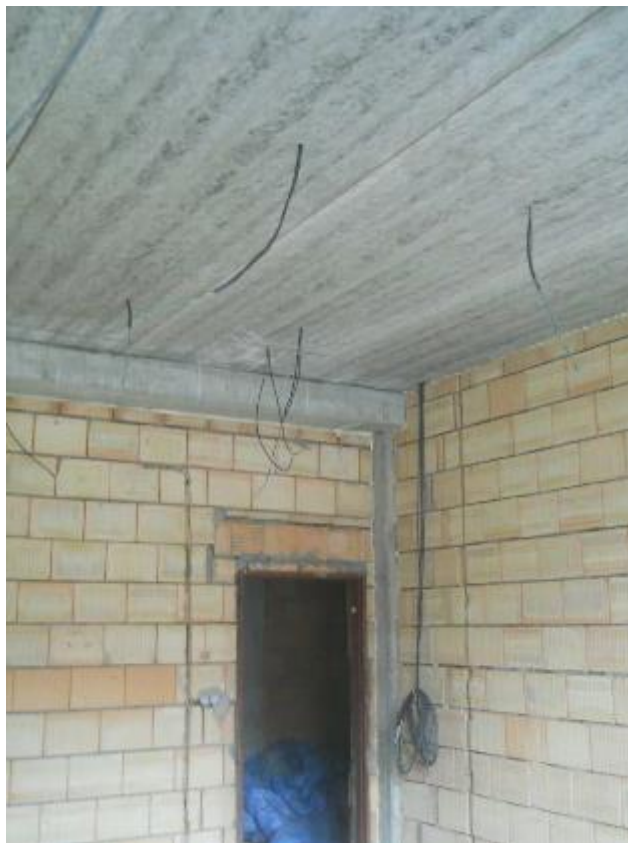
Zahájení provádění rozvodů elektroinstalace