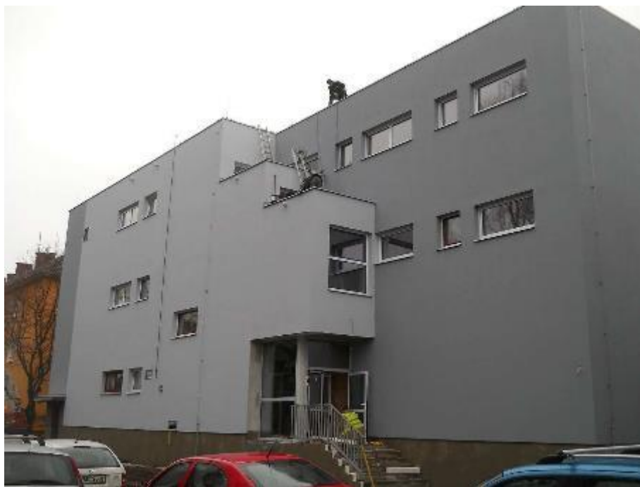
Finální omítka severní fasády