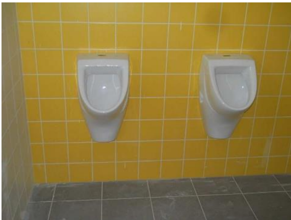
Kompletace sanitárních zařizovacích předmětů