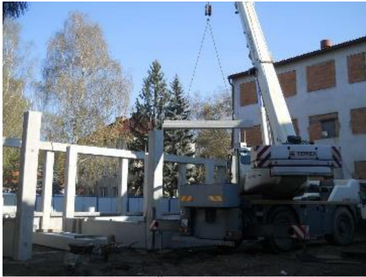
Montáž ŽB skeletu –1.NP