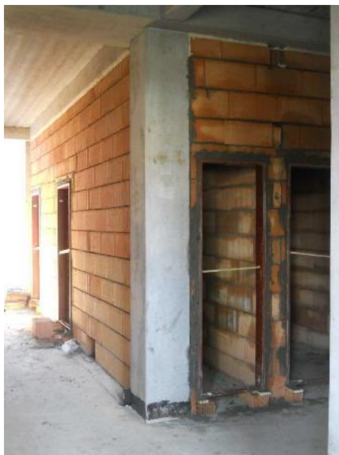
Vyzdívání vnitřních stěn a příček