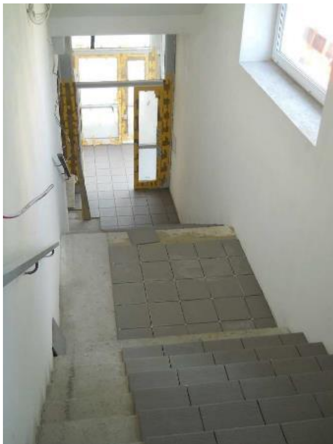
Provádění keramického obkladu schodiště