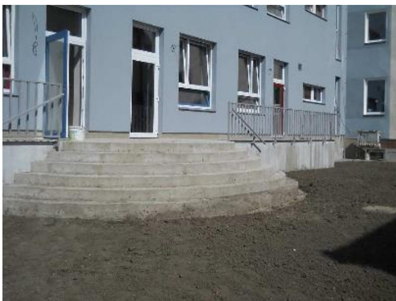
Montáž zábradlí na terase a provádění terénních úprav