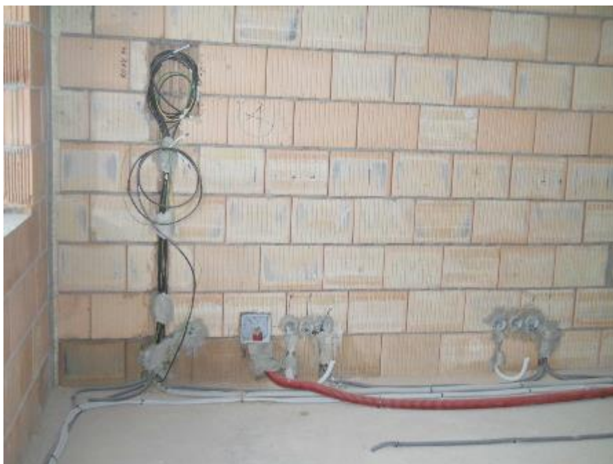
Provádění vnitřních rozvodů (elektroinstalace)