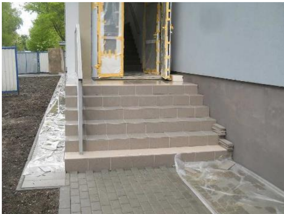
Provedení dlažby venkovního vstupního schodiště