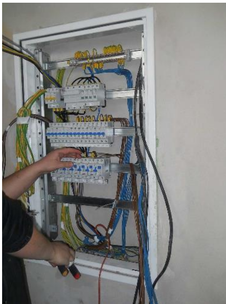
Kompletace rozvaděčů elektro