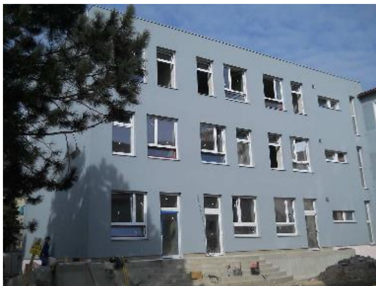
Provedená finální omítka jižní a západní fasády