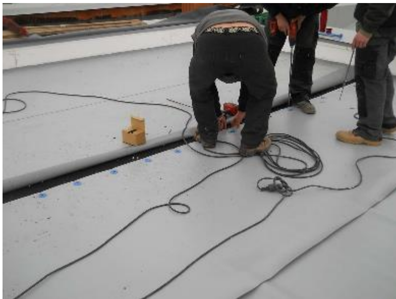
Kotvení fóliové hydroizolace střešního pláště