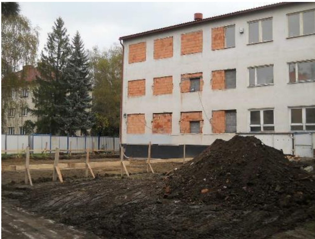
Provedení vyzdívek otvorů ve stávající budově v prostoru přístavby