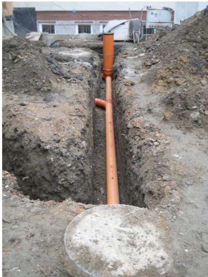
Provádění venkovní kanalizace