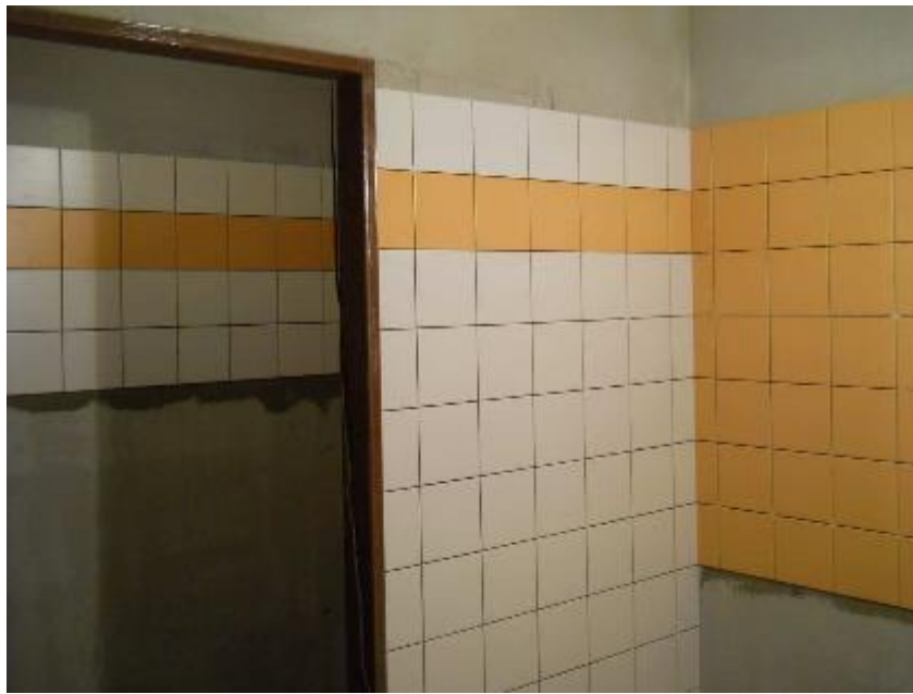
Provádění obkladů v prostorech sociálního zařízení