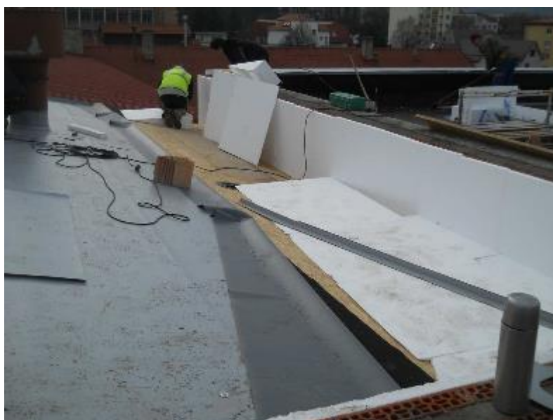
Provádění nového střešního pláště na části střechy původní budovy