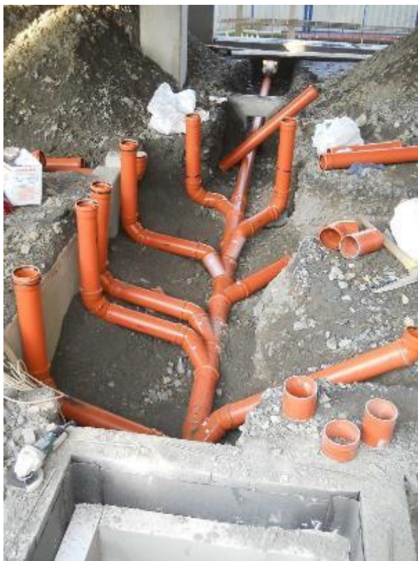
Montáž ležaté kanalizace