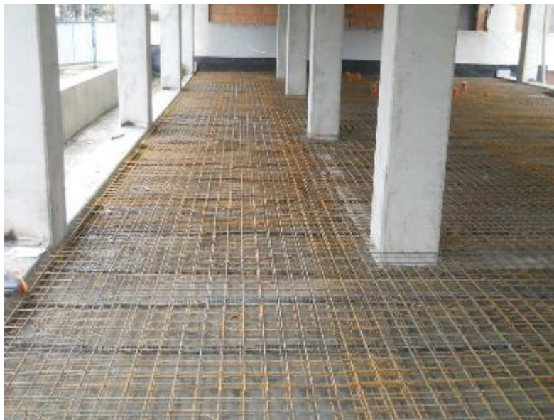
Výztuž podkladního betonu z kari sítě