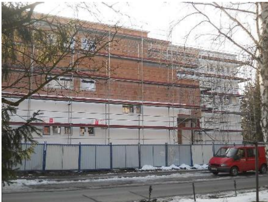
Lepení izolantu zateplení na severní fasádě