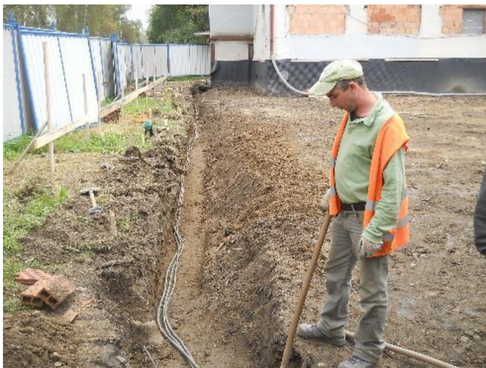
Úprava trasy slaboproudých kabelů Telefonica mimo půdorys přístavby