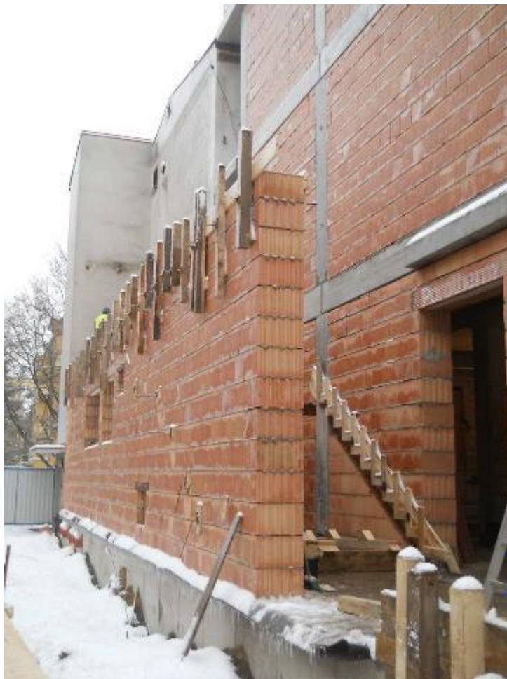
Zdění chodbového traktu – 1.NP