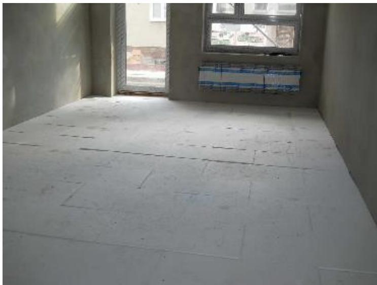
Položená tepelná izolace z EPS 100 v 1.NP