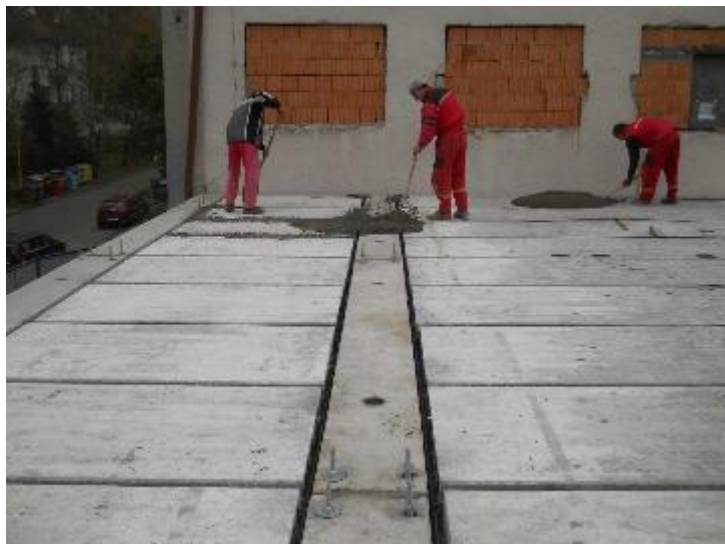
Zalévání spár betonovou směsí