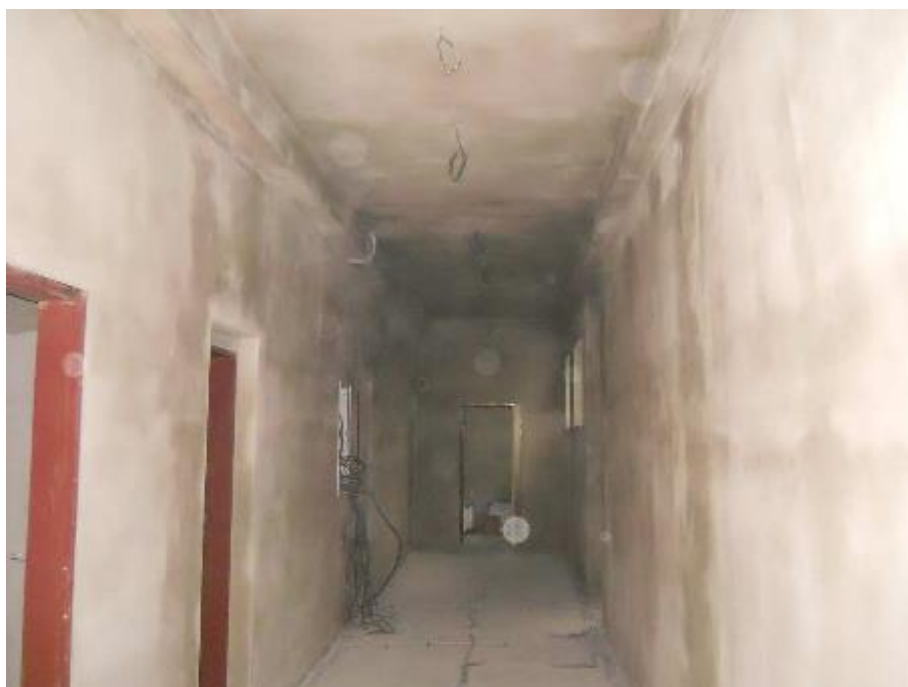
Provádění omítek ve 2.NP