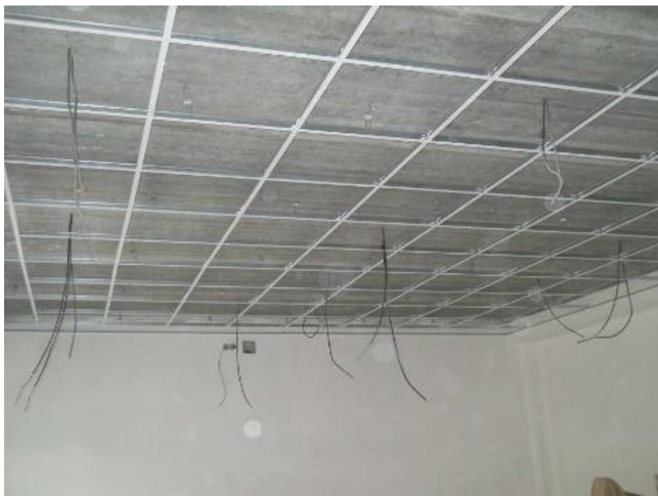
Zahájení montáže akustických obkladů