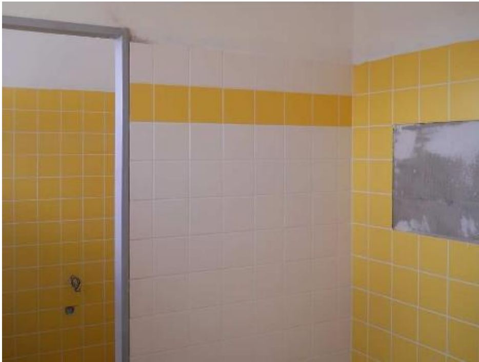
Keramické obklady v sociálních zařízeních