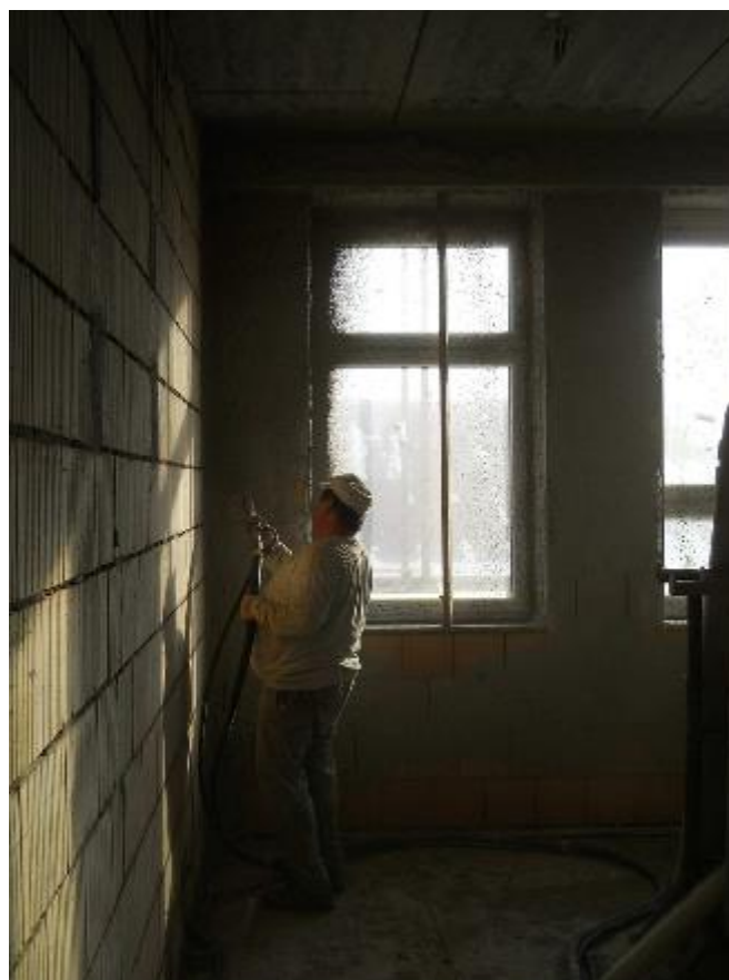
Strojní nanášení vnitřních omítek