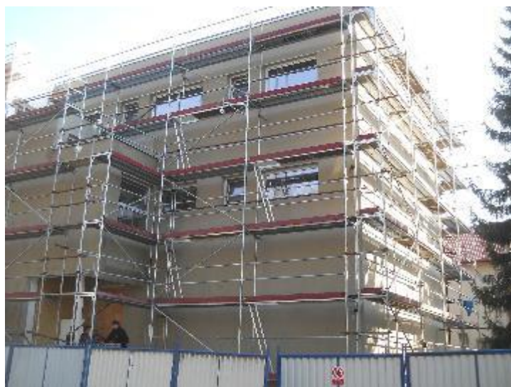
Provedená stěrková vrstva ETICS na severní fasádě