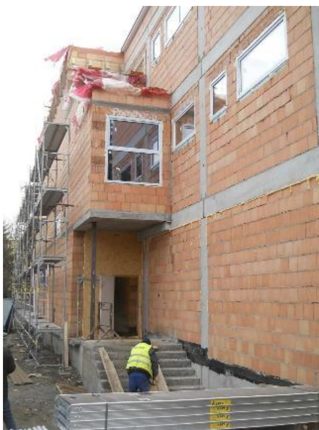
Dokončení montáže plastových oken – severní fasáda