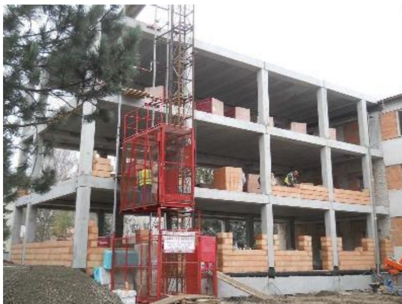
Ukončení montáže ŽB skeletu a zahájení vyzdívek obvodového pláště