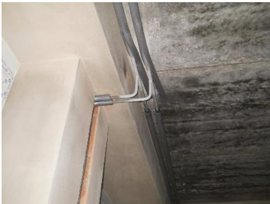
Montáž rozvodů vytápění