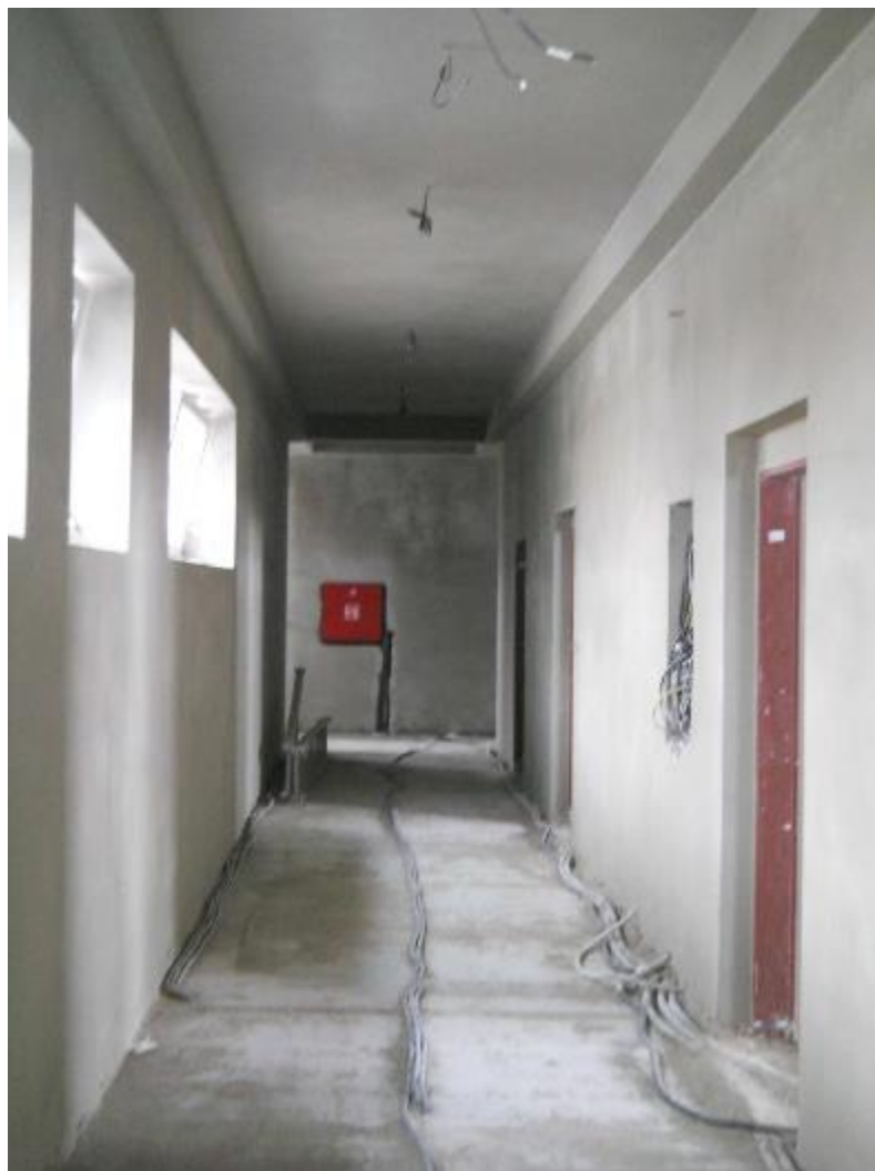
Vnitřní omítky ve 3.NP