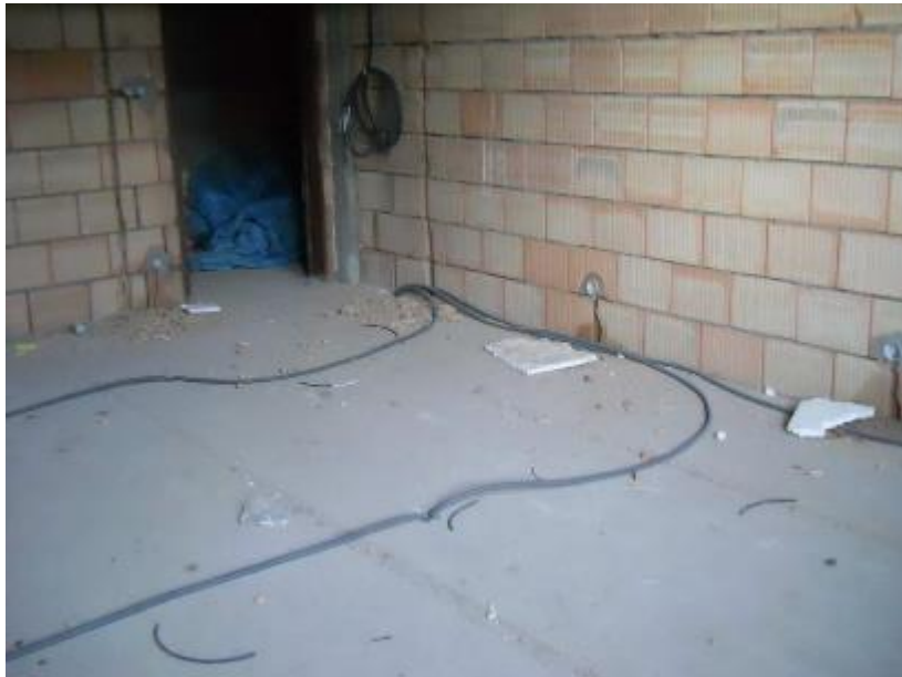
Zahájení provádění rozvodů elektroinstalace