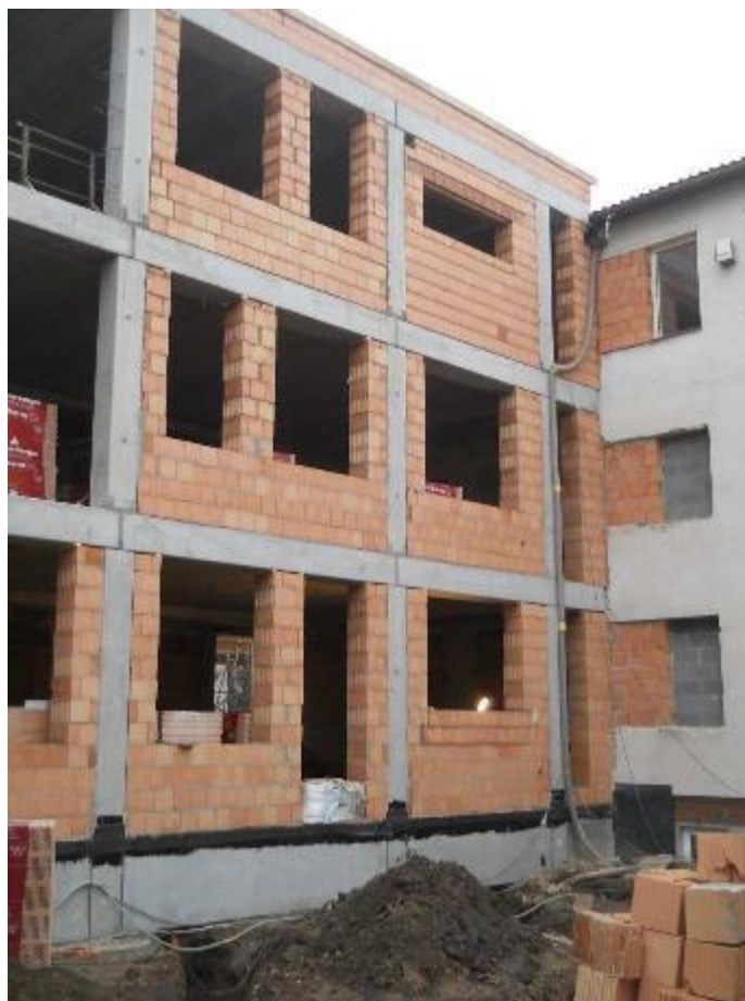
Zdivo obvodového pláště – jižní fasáda