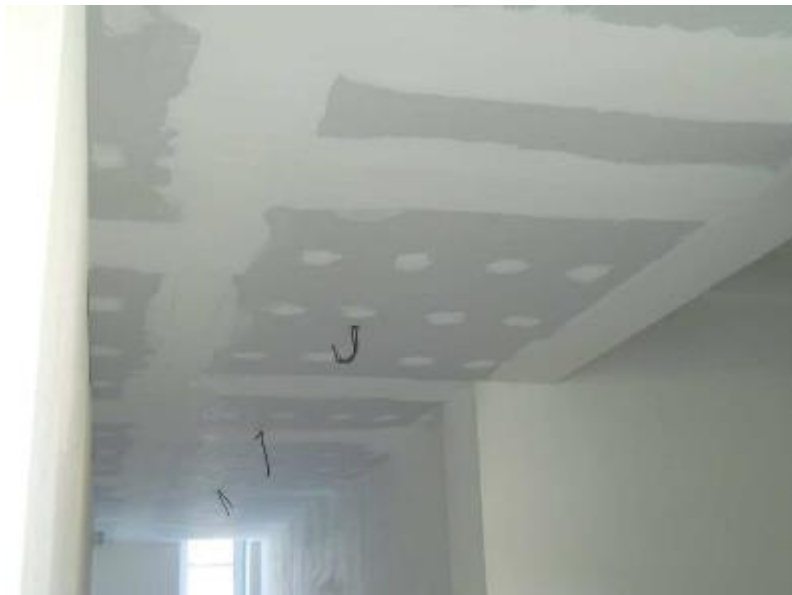
Sádrokartonové konstrukce - tmelení