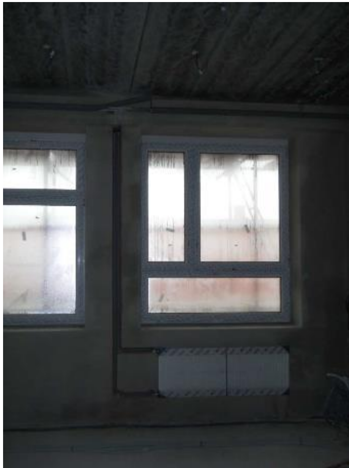
Montáž rozvodů a topných těles vytápění