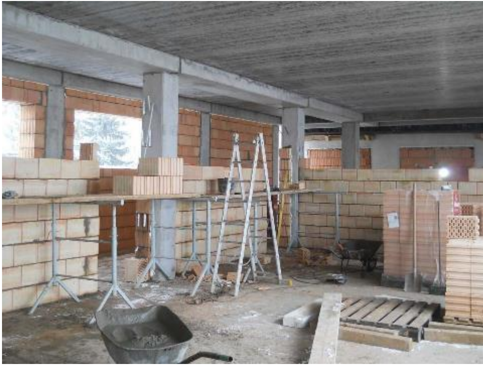
Vyzdívání vnitřního zdiva