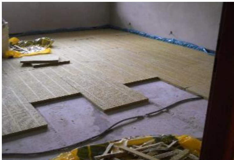
Pokládání kročejové izolace z minerální vaty v 2. A 3.NP