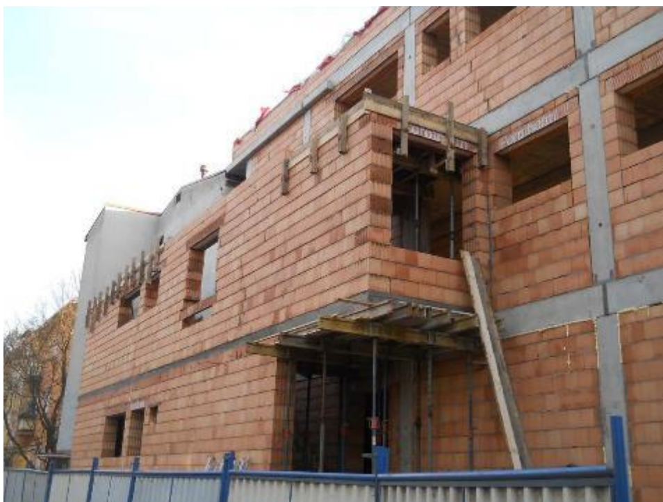
Hrubá stavba chodbového traktu s monolitickými stropy (1.a 2.NP)