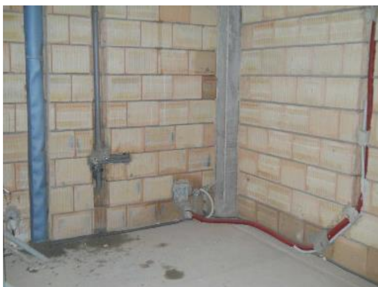
Provádění vnitřních rozvodů (ZTI, elektroinstalace)