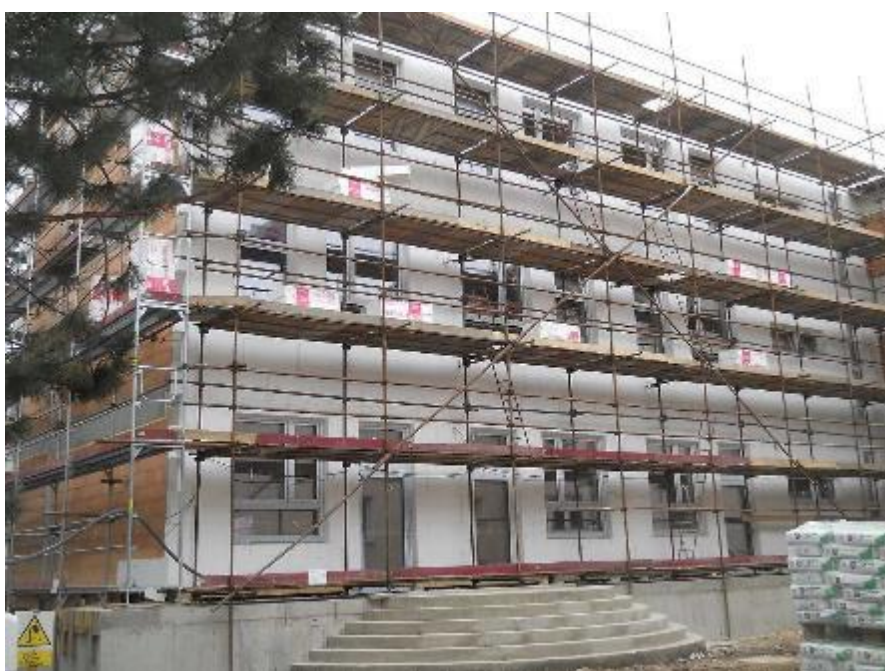
Lepení izolantu zateplení na jižní fasádě