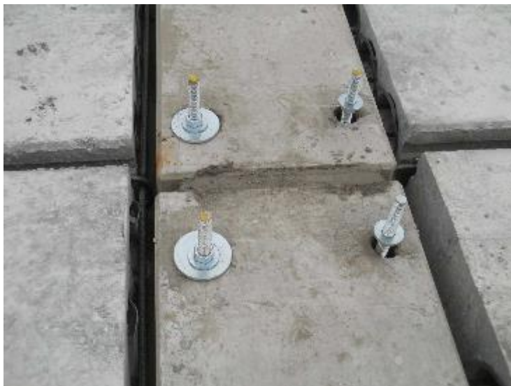
Kotvení šrouby a záливková výztuž