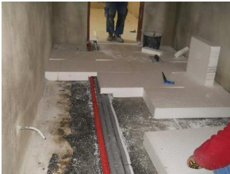
Pokládání tepelné izolace z EPS 100 v 1.NP