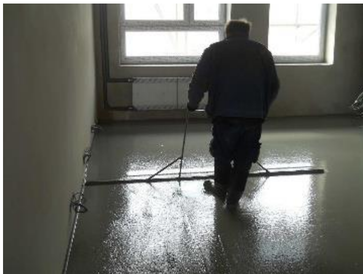
Provádění litých podlahových potěrů