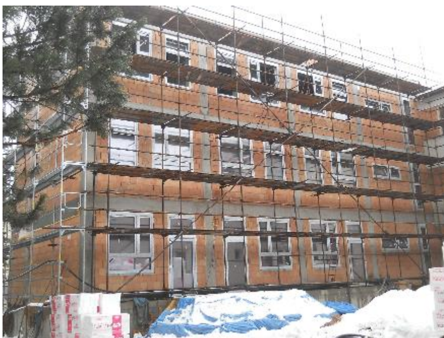
Postavené fasádní lešení