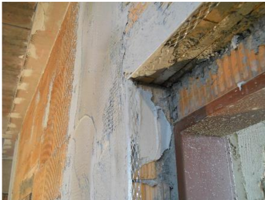
Osazování rohových omítkových profilů