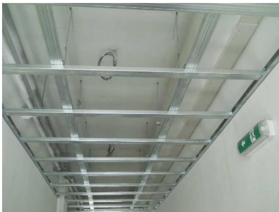
Montáž sádkartonových krytů instalací – nosná konstrukce