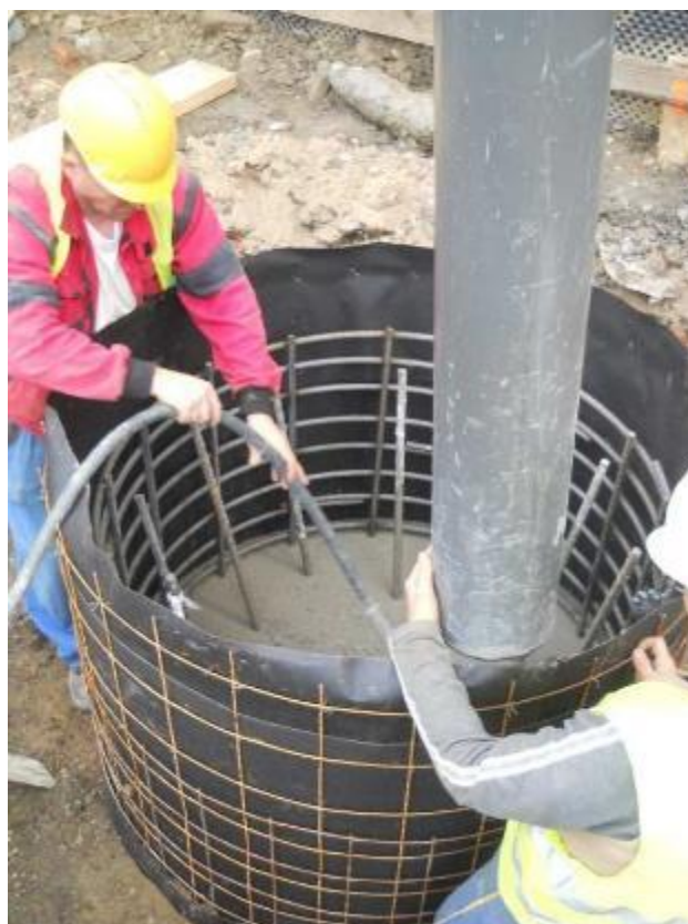
Pilotovací práce – betonáž hlavic pilot