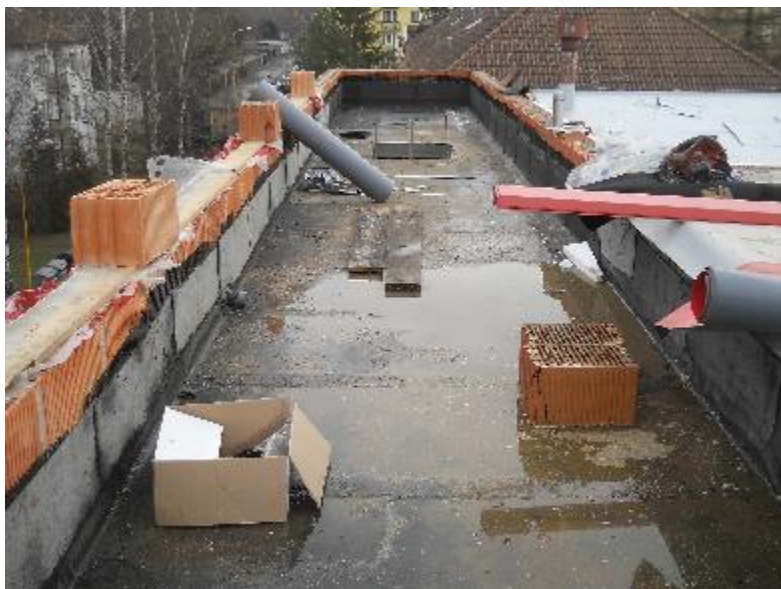
Dokončení hrubé stavby komunikačního traktu – střecha s provizorní hydroizolací (parozábrana)