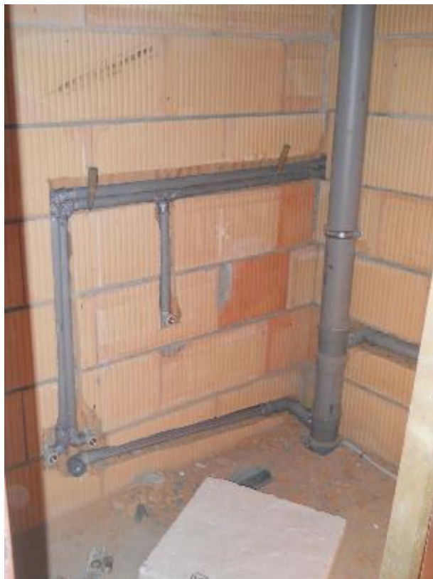
Provádění vnitřních rozvodů v sociálních zařízeních (ZTI)