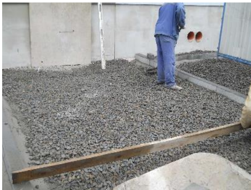
Provádění podkladních vrstev zpevněných ploch