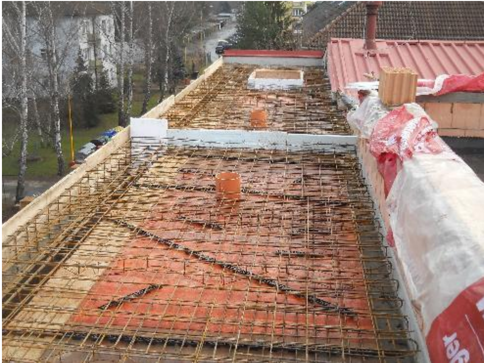
Strop nad 3.NP monolitického chodbového traktu před betonáží