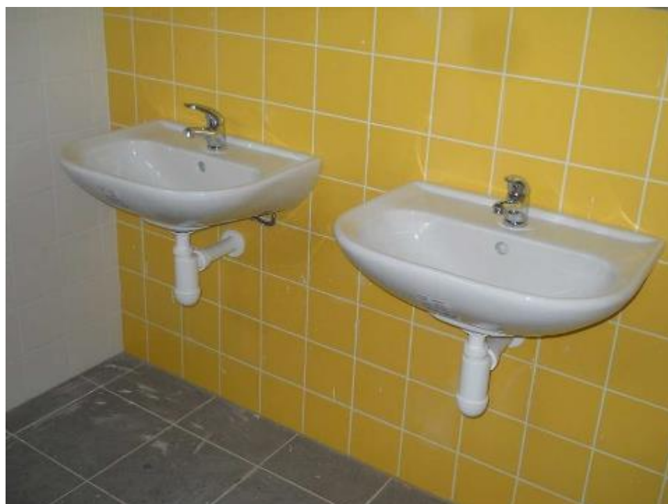
Kompletace sanitárních zařizovacích předmětů