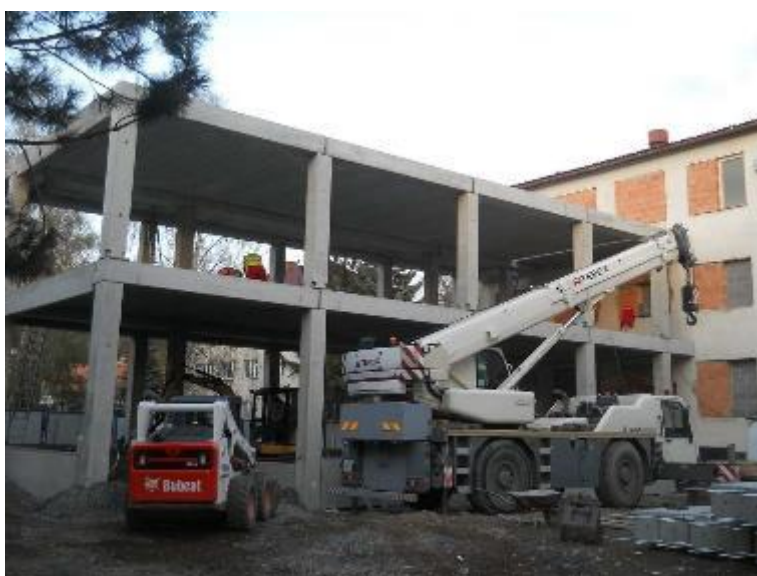
ŽB skelet včetně stropních panelů – 2.NP