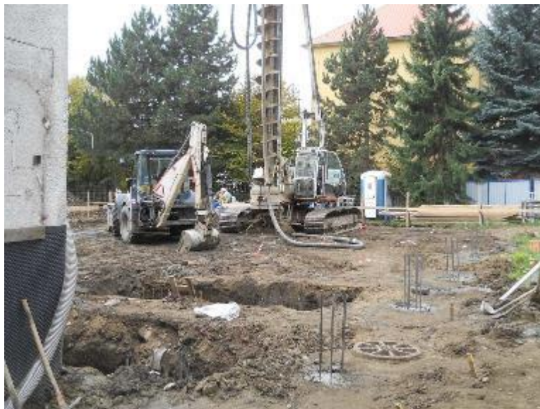
Pilotovací práce – vrtání pilot