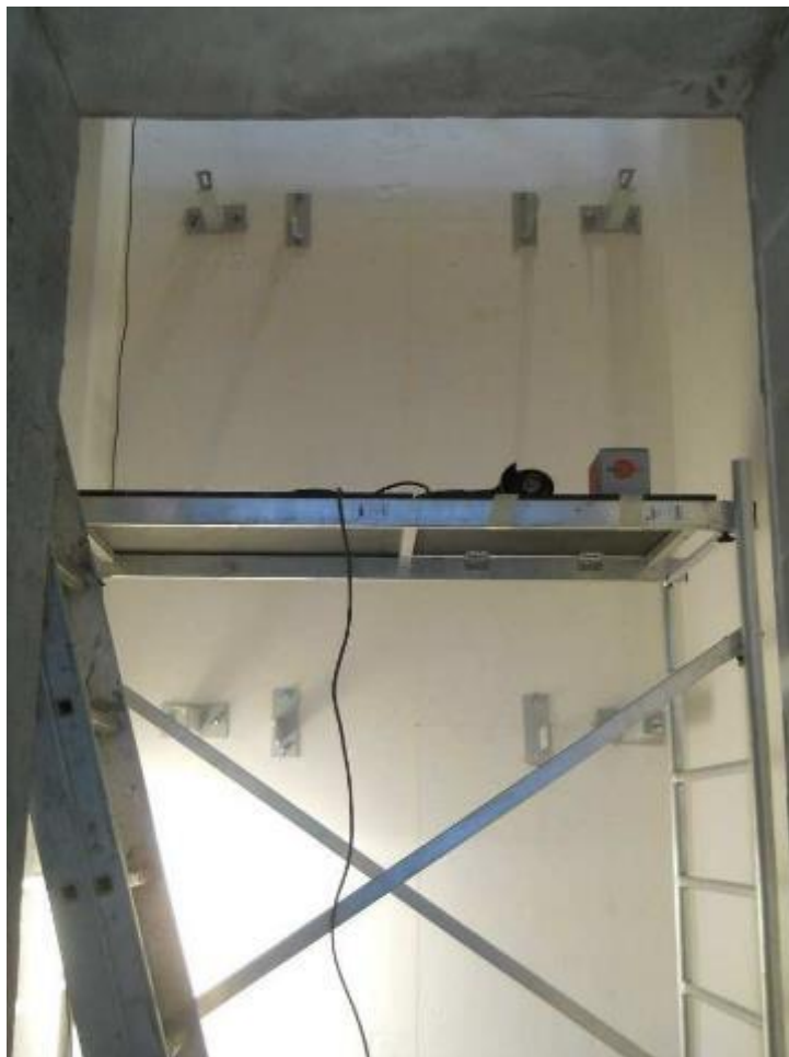
Zahájení montáže výtahu