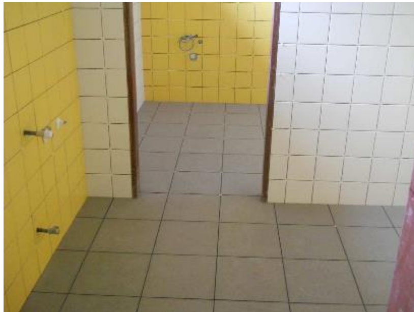
Keramické obklady a dlažby v prostorech sociálního zařízení