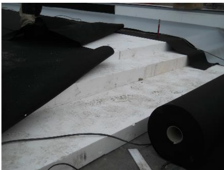
Vrstvy tepelné izolace střešního pláště z EPS