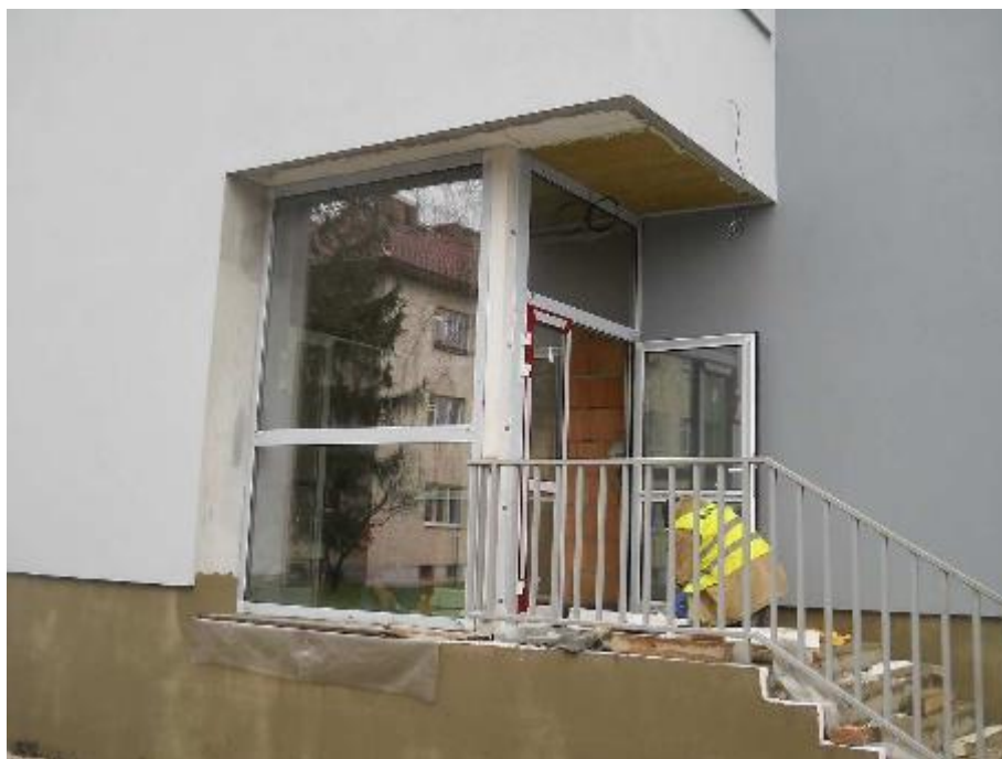
Montáž hliníkových výplní otvorů (vstup) a zámečnické výrobky (zábradlí)