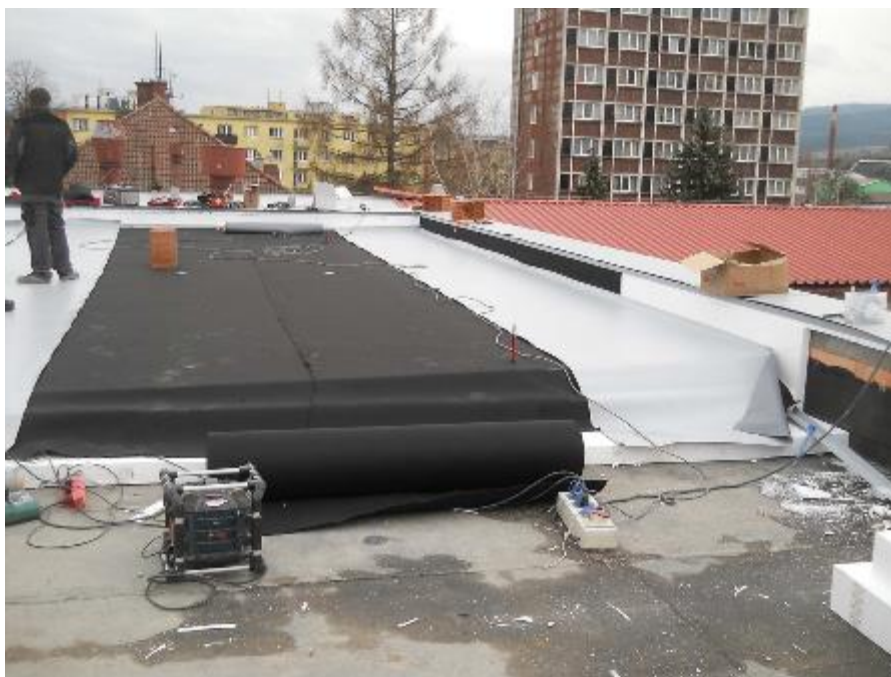
Provádění střešního pláště