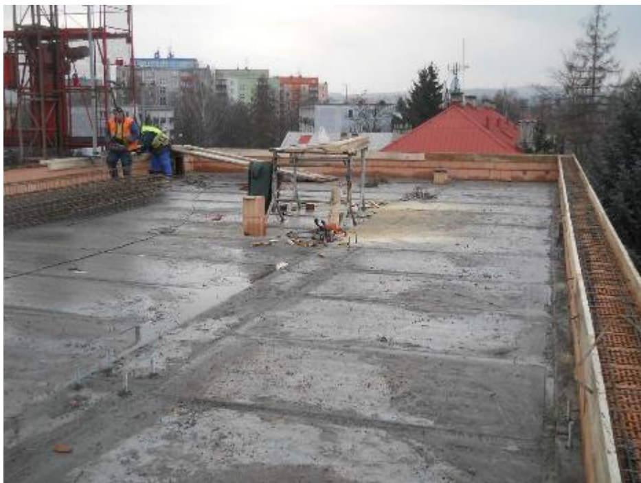
Střecha - provádění atiky