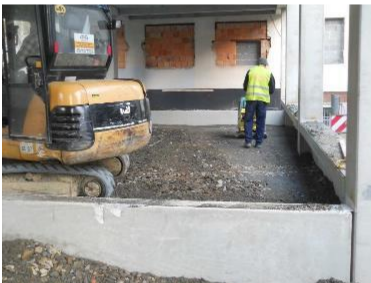
Provádění a hutnění štěrkových násypů