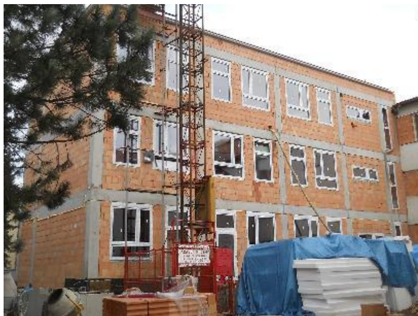
Dokončení montáže plastových oken a dveří – jižní fasáda