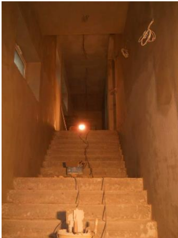
Provádění omítek ve schodišťovém prostoru (1.NP)