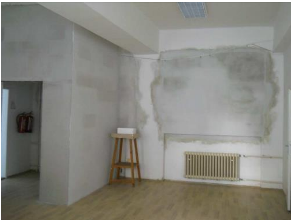
Zazdívky otvorů a úpravy dispozice ve stávající budově včetně omítek