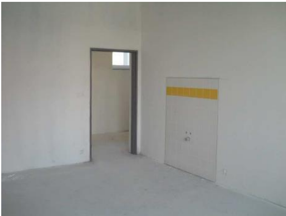
Keramický obklad a první nátěr malby v učebně