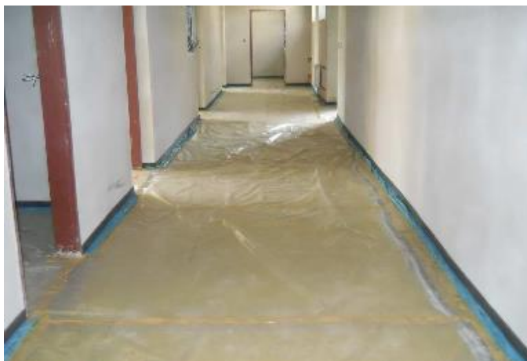
Provedení separační PE fólie pod litý potěr