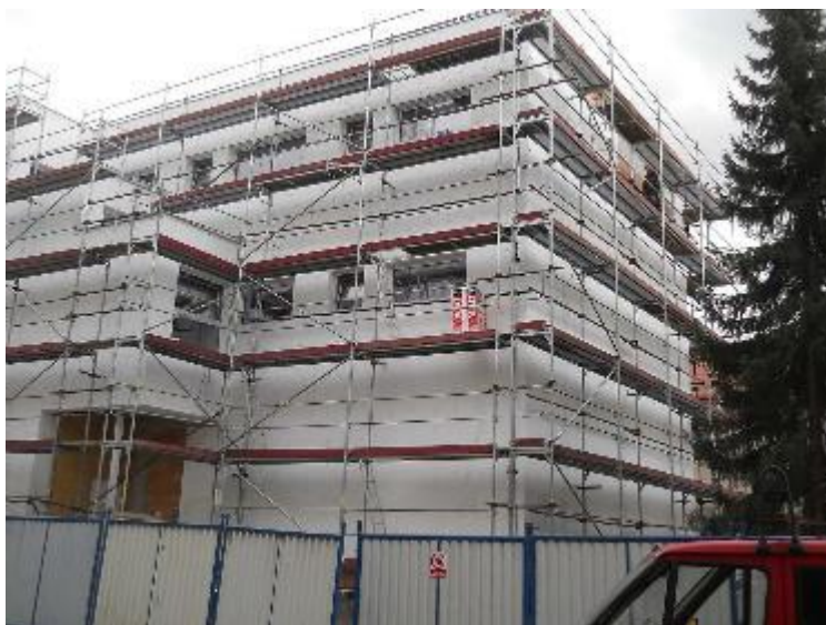
Nalepená tepelná izolace z fasádního EPS