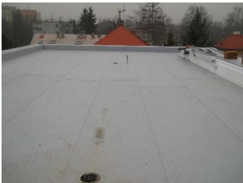
Hotový střešní pláš