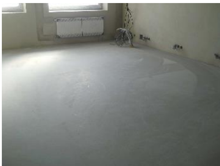
Provedené podlahové potěry