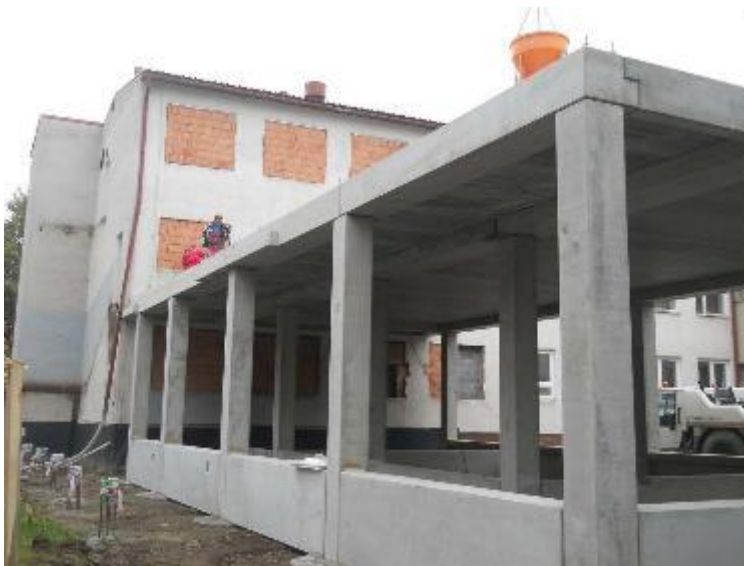
ŽB skelet včetně stropních panelů – 1.NP