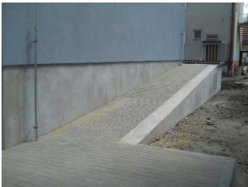
Zpevněné plochy kolem objektu ze zámkové dlažby