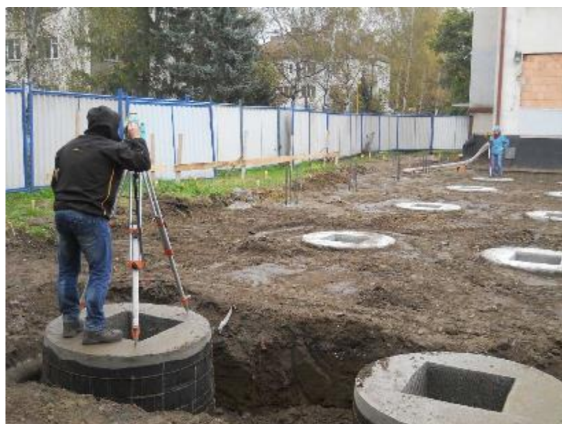
Dokončené piloty s hlavicemi a kalichy pro sloupy – geodetické vyměrování os modulového systému