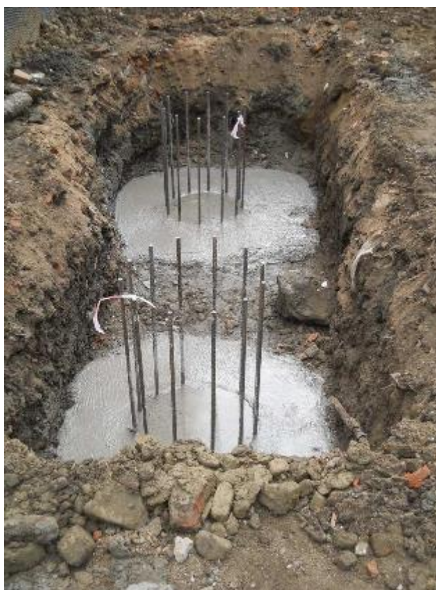
Pilotovací práce – zabetonované dřívky piloty s výztuží