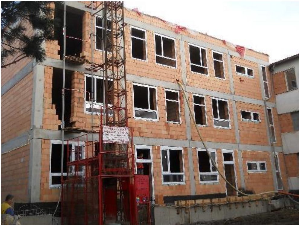
Osazování plastových oken