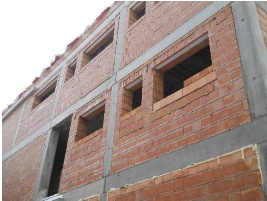
Zdivo obvodového pláště – severní fasáda