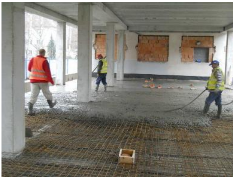
Betonáž podkladního betonu