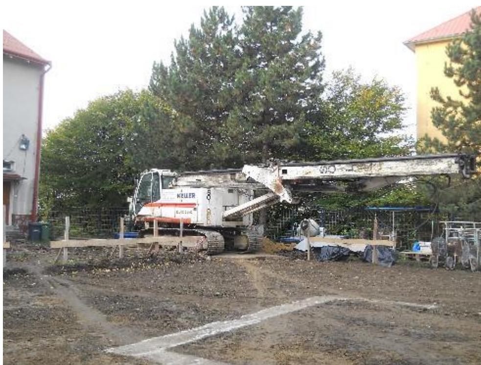
Nájezd vrtací soupravy – příprava pilotáže