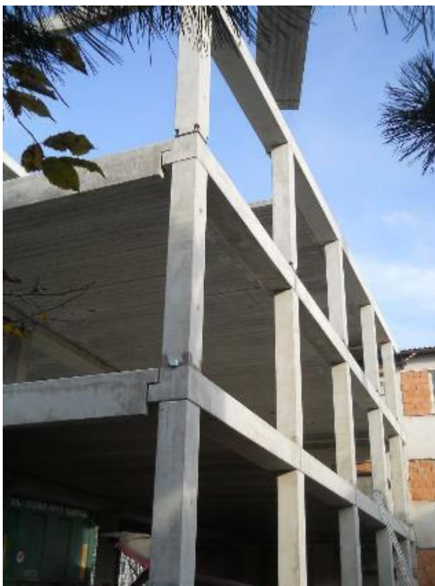
Montáž 3.NP ŽB skeletu