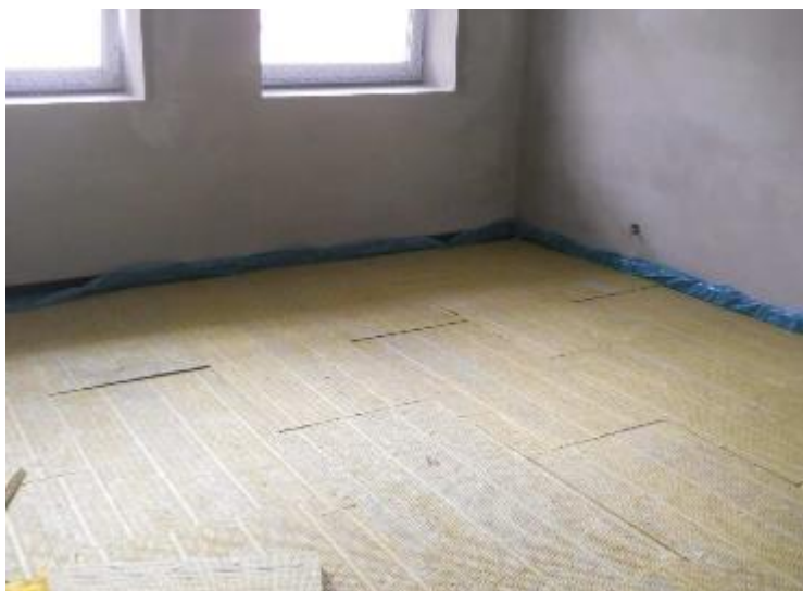
Položená kročejová z minerální vaty